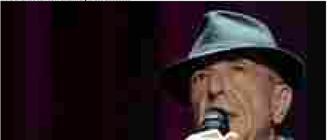
Leonard Cohen, i figli fanno causa all'avvocato