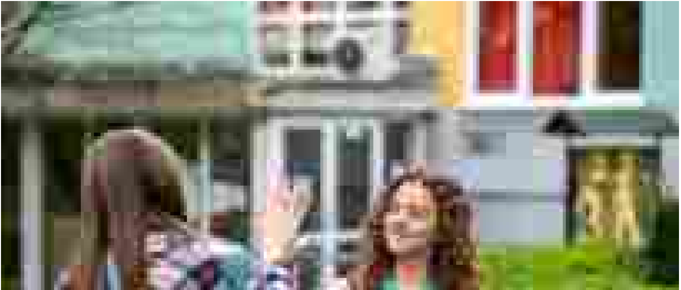
Cosa fare da grandi? 6 studenti su 10 hanno già le idee chiare