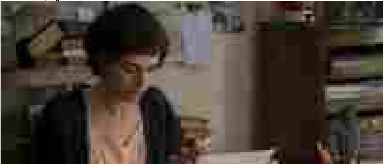
Miriam Leone, la mia Oriana libera e coraggiosa

Ritaglio stampa ad uso esclusivo del destinatario, non riproducibile.