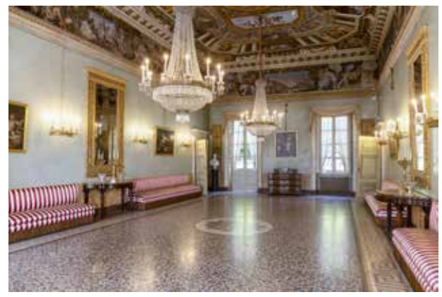
Sala della Gerusalemme Liberata