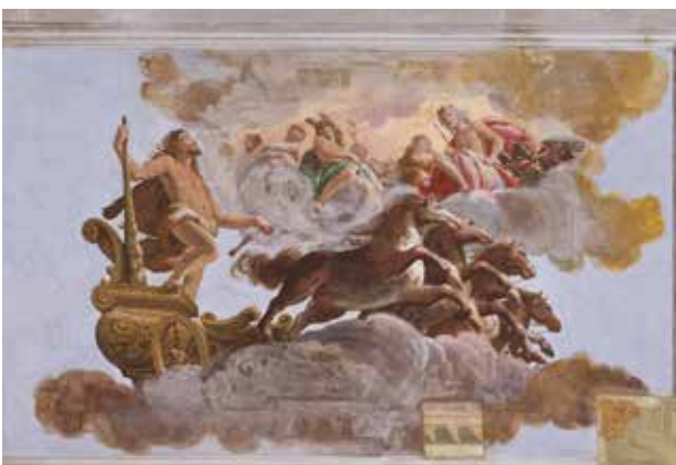
Sala di Ercole