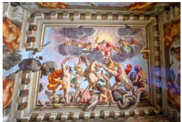
Sala dei Giganti