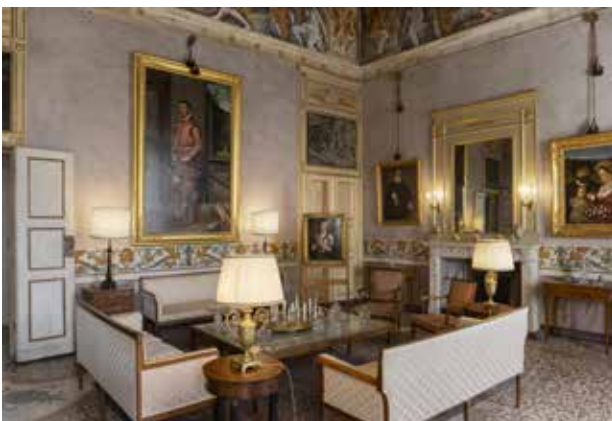
Sala dell'Età dell'Oro